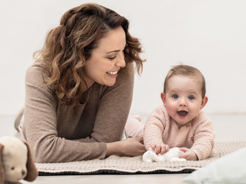
Durchbruch der Milchzähne

Jeder Reiz in der Mundhöhle – ob Finger oder Spielzeug, Druck oder Schmerz – kurbelt die Speichelproduktion an. Mit Finger, Fäustchen und allem anderen, was das Kind sich in den Mund steckt, gelangen Keime in die Mundhöhle, und von dort aus in die Atemwege sowie in den Magen-Darm-Trakt, wo sie bei manchen Kindern Durchfall auslösen können. Mütter berichten von ungewöhnlich übelriechendem Windelininhalt während der Zahnungszeit. Aber nicht jedes Kind bekommt einen dünnen Stuhl, auch Babys reagieren schon unterschiedlich – manche bekommen eine Darmträgheit, also Verstopfung.